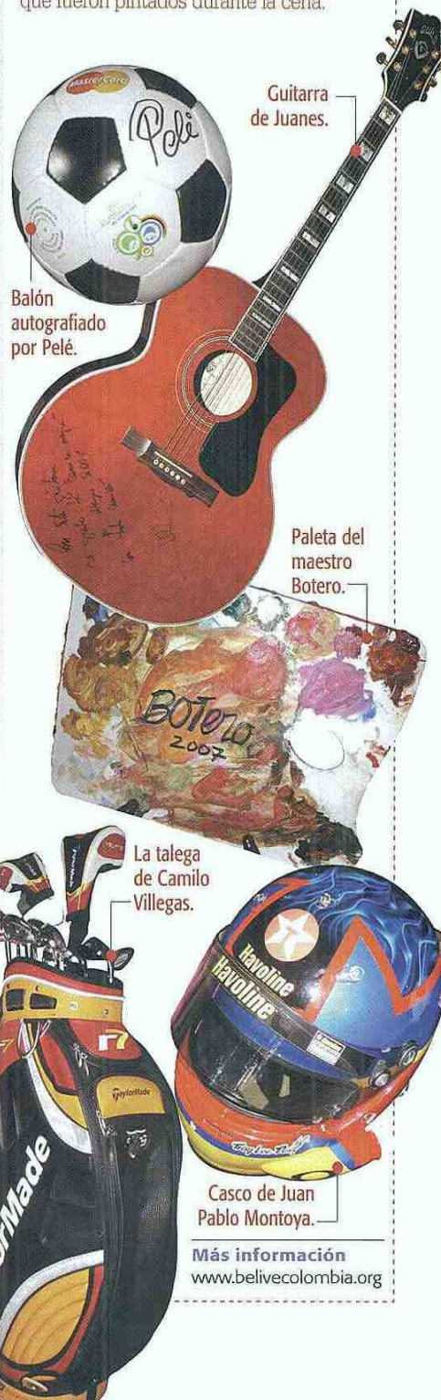
Guitarra de Juanes.