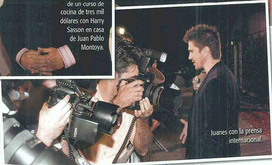
Juanes con la prensa internacional.

Se recolectó un millón de dólares durante la velada, dinero destinado a ayudar a los colombianos más necesitados.